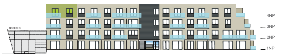
Východní pohled na dům / Building View - east side